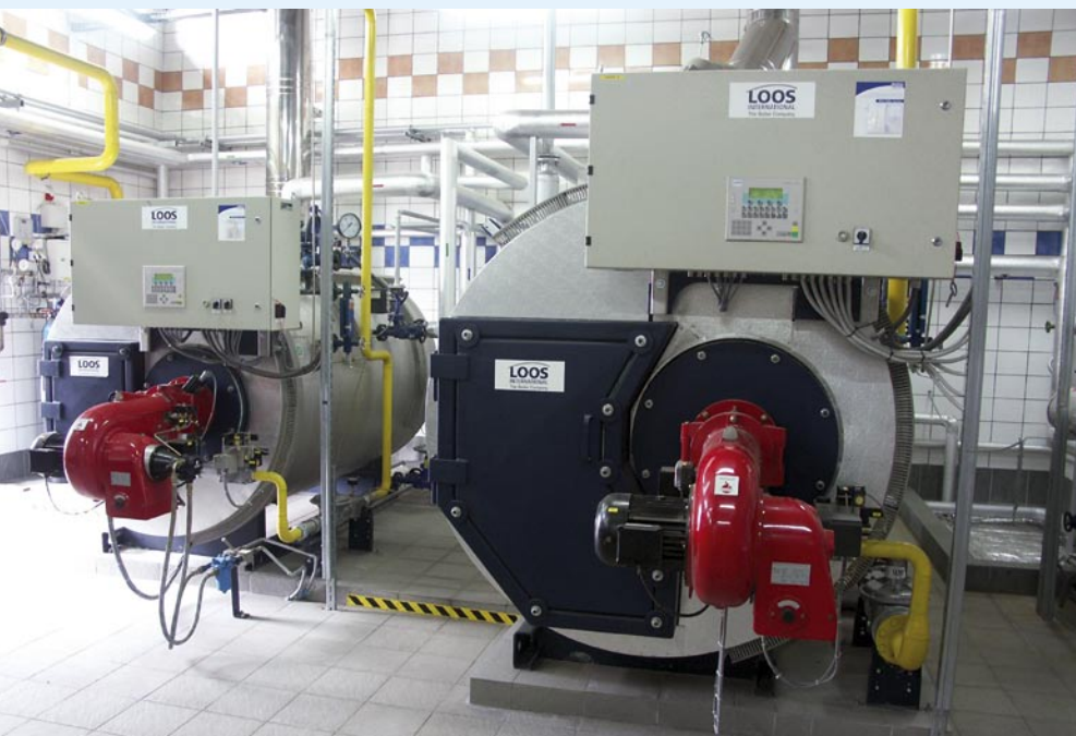
Rys. 1. Kocioł parowy LOOS Universal w zakładzie mleczarskim

Jak szybko praktyczne rady specjalistów przekładają się na efektywniejsze działanie zakładu i na korzystniejsze warunki pracy kotła parowego? Raport ten pokazuje korzyści wynikające z właściwego doboru kotłów parowych, a co za tym idzie wymierne zyski finansowe.