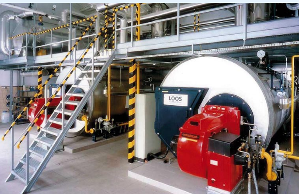
Rys. 3. Nowoczesna kotłownia parowa LOOS INTERNATIONAL w zakładzie mleczarskim

LOOS INTERNATIONAL KOTŁY PRZEMYSŁOWE LOOS Centrum Sp. z o.o. ul. Marii Kazimiery 35 01-641 Warszawa tel. 0-22 561-90-90 fax 0-22 561-90-99 loos@loos.pl www.loos.pl