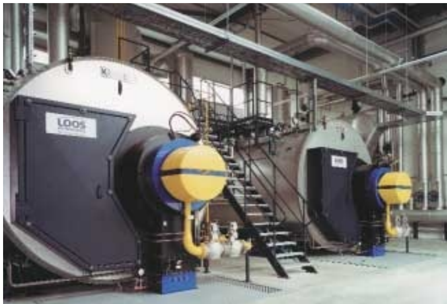
Industriekesselanlage mit Kesseln gleicher Leistung und gleichen Brennergrößen bei weniger Dampfbedarf kann jederzeit problemlos umgerüstet werden.

W związku z tym brany pod uwagę późniejszy wzrost zapotrzebowania mocy też trzeba uwzględnić przy wyborze wielkości kotła, gdyż tu praktycznie nie wynikają żadne niekorzyści (por. raport branżowy „Jaki kocioł parowy na jakie zapotrzebowanie”). Palniki natomiast trzeba dobierać tak, aby w razie wzrostu zapotrzebowania można było je wymienić - co w przypadku kotłów przemysłowych i komunalnych nie stanowi problemu.