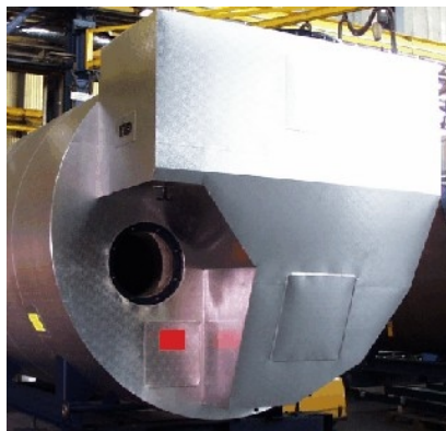
Zdjęcie fabryczne kotła UL-S-IE z zaizolowanym i otworami rewizyjnymi

Zakładana przez LOOS izolacja z płaszczem ochronnym z aluminium pozbawionego metali ciężkich, o strukturalnej powierzchni, spełni każde wymagania. Kotły przeznaczone do ustawienia na wolnym powietrzu zostaną wyposażone w izolację przeciwwatmospheryczną, a do ochrony przed powietrzem agresywnym zastosujemy odporne materiały, np. aluminium odporne na działanie wody morskiej.