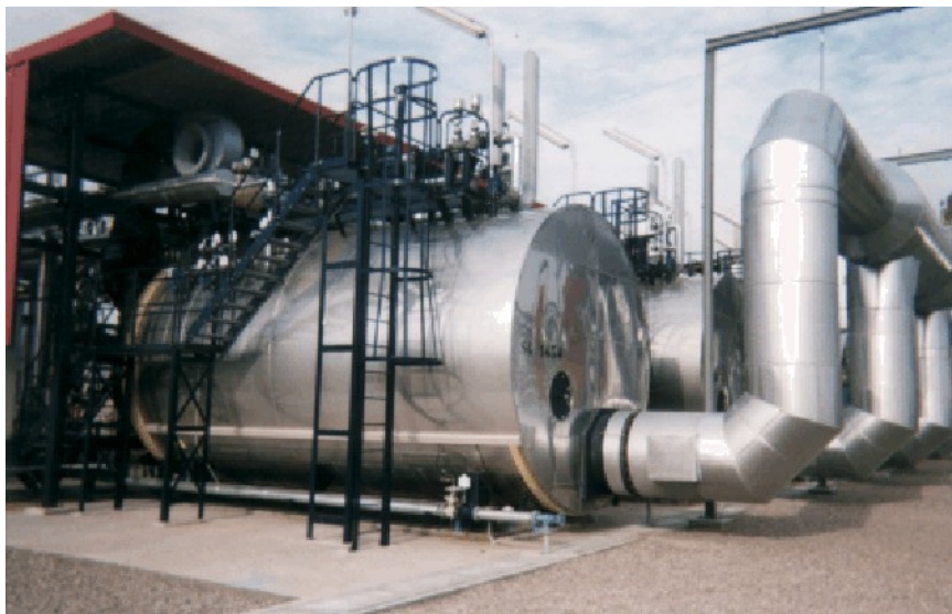
Wolno stojący kocioł w firmie produkującej oleje mineralne we Francji

Stosuje maty z włókna mineralnego, jak do izolacji budynków, i ulegające biodegradacji ceramiczne maty izolacyjne. Stosowane materiały izolacyjne mogą być odprowadzane, jak gruz budowlany, na wszystkie przeznaczony do tego celu składowiska odpadów.