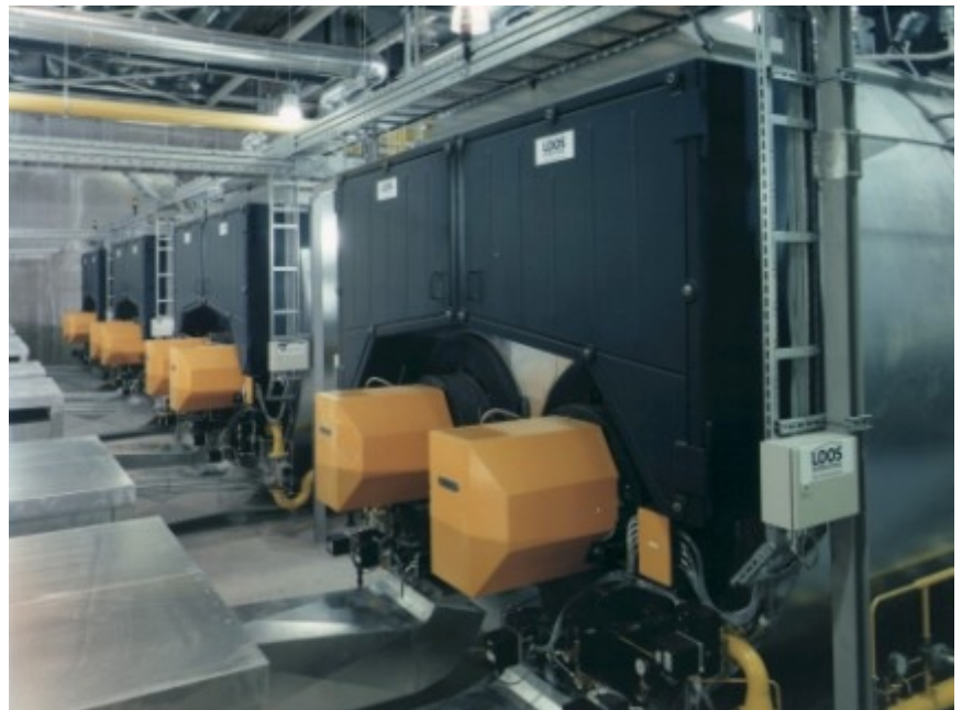
Vier Zweiflammrohr-Rauchrohrkessel UNIVERSAL ZFR für 120 t/h Dampfleistung in einer Papierfabrik

trzebowaniu podstawowym 10 t/h. Chociaż w trybie normalnym nie potrzeba więcej niż 90 t/h, wszystkie cztery kotły pracują na tym samym obciążeniu (75 %) z dobrą sprawnością obciążenia częściowego. Jeden kocioł można by, z różnych względów, czasowo wyłączyć, a nie miałyby to wpływu na produkcję.