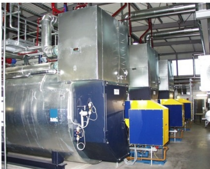
Przykład zastosowania 3 kotłów parowych z przegrzewaczami w fabryce papieru

LOOS INTERNATIONAL jest kompetentnym partnerem dla przemysłu papierniczego.