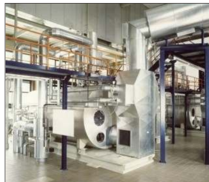
Kocioł parowy UNIVERSAL z kompaktowym ekonomizerem ECO-S.A. o wydajności parowej od 1-28 t/h

Każdy kocioł płomieniowo-płomieniówkowy można wyposażyć w ekonomizer. I w tym właśnie celu LOOS INTERNATIONAL skonstruował ekonomizer kompaktowy, dopuszczony do eksploatacji przez UDT. Zaizolowany ekonomizer jest dostarczany na ramie transportowej jako urządzenie gotowe do połączenia. Ekonomizer montuje się bezpośrednio za kotłem w przewodzie spalinowym i podłącza do przewodu wody zasilającej.