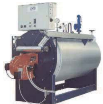
Rys. 1: Szybka wytwornica pary Dampffix wyposażona w automatykę ABA-DF

Przy wyłączeniu lub zatrzymaniu wytwornicy automatyka ABA-DF zapobiega przekroczeniu maksymalnego ciśnienia w wężownicy i tym samym zbędnemu otwarciu zaworu bezpieczeństwa. W czasie postoju lub zatrzymania utrzymywane jest niewielkie nadciśnienie, tylko tak duże aby zapobiec korozji w wężownicy. Przy rozruchu po dowolnie długim czasie postoju automatyka tylko w razie potrzeby włącza płukanie wężownicy lub podgrzewanie wody zasilającej. Po uzyskaniu żądanej temperatury wody zasilającej i odpowiednich parametrów pary, rozpoczyna się faza wytwarzania pary dla celów technologicznych.